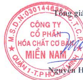
Nguyễn Hữu Thọ