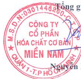
Nguyễn Hữu Thọ