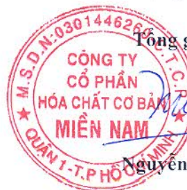
Nguyễn Hữu Thọ